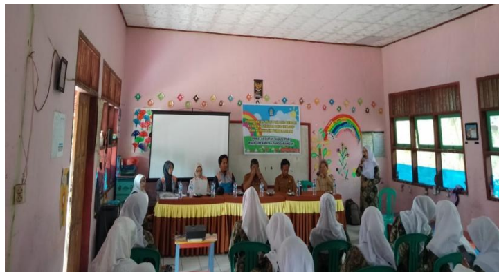
Gambar 5. kegiatan Pelatihan Pembuatan PPI yang dihadiri oleh 30 Orang Guru PAUD

Kegiatan ini terselenggara atas kerja sama KidzSmile Foundation dan Pusat Kegiatan Gugus (PKG) PAUD Kecamatan Panggarangan. PKG PAUD Kec. Panggarangan mengundang seluruh anggotanya, yaitu 26 lembaga Kelompok Bermain (KB), Taman Kanak-kanak dan satuan Pendidikan sederajat lainnya, namun karena terkendala akan letak geografis dan cuaca (beberapa lembaga KB dan TK berada di gunung, dan karena hujan sehingga jalanan sangat berlumpur, bahkan terdapat wilayah yang tidak dapat dilalui karena lumpur yang mencapai betis orang dewasa) sehingga peserta yang datang kurang lebih 30 orang yang mewakili 26 lembaga.