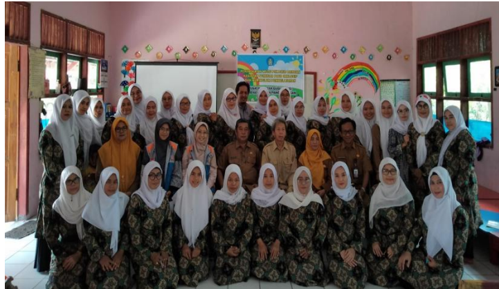
Gambar 4. Pembukaan dihadiri oleh Camat dan Lurah

Kegiatan ini terselenggara atas kerja sama KidzSmile Foundation dan Pusat Kegiatan Gugus (PKG) PAUD Kecamatan Panggarangan. PKG PAUD Kec. Panggarangan mengundang seluruh anggotanya, yaitu 26 lembaga Kelompok Bermain (KB), Taman Kanak-kanak dan satuan Pendidikan sederajat lainnya, namun karena terkendala akan letak geografis dan cuaca (beberapa lembaga KB dan TK berada di gunung, dan karena hujan sehingga jalanan sangat berlumpur, bahkan terdapat wilayah yang tidak dapat dilalui karena lumpur yang mencapai betis orang dewasa) sehingga peserta yang datang kurang lebih 30 orang yang mewakili 26 lembaga.